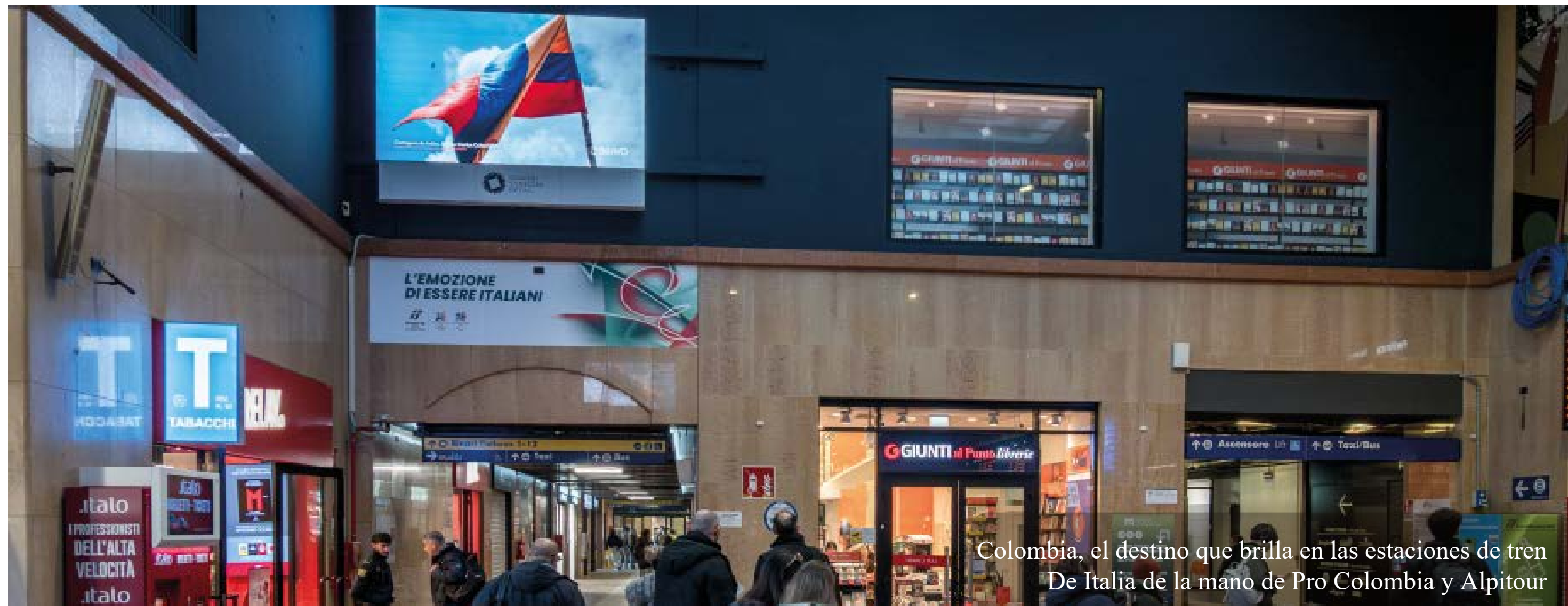
Colombia, el destino que brilla en las estaciones de tren De Italia de la mano de Pro Colombia y Alpitour

El país de la belleza se toma del 8 al 22 de diciembre más de 570 pantallas de las estaciones de tren de Italia, uno de los medios de transporte más usados del país, para que los viajeros puedan contemplar lo mejor de la cultura y naturaleza que les espera en el Gran Caribe Colombiano, resultado de la colaboración entre el grupo italiano Alpitour (que en diciembre opera su ruta directa Milán – Cartagena) y ProColombia con el apoyo de la Embajada de Colombia en Italia.